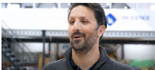
Pôle Course au Large Incidence - Episode #1

Pour en savoir plus sur la préparation des skippers et la conception des voiles qui équipent les IMOCA :